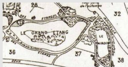
Extrait du plan Walter