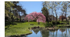
Projection de la plantation au miroir

Si vous êtes riverains d'un secteur et que vous constatez des actions en cours ou à venir (marquage - taille - tonte différenciée) et que cela vous interroge, n'hésitez pas à poser vos questions à la commission pour en connaître les détails.