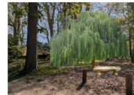
Projet de plantation étang sec

En remplacement, quelques plantations de type verger sont envisagées pour leur floraison printanière très agréable.