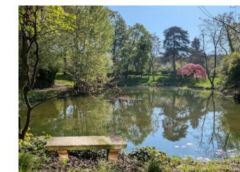
L'un des nouveaux bancs avec la vue projetée

La commission se réunit tous les 2 mois environ pour établir et suivre les projets d'entretien du domaine. Vous pouvez nous rejoindre !