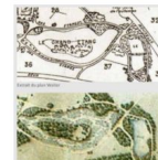
Une vue ancienne de l'étang sec