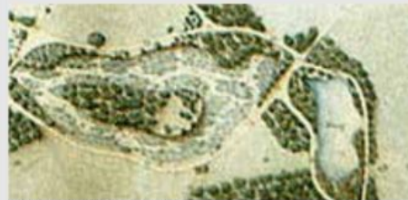
Extrait du plan Coppin de 1911