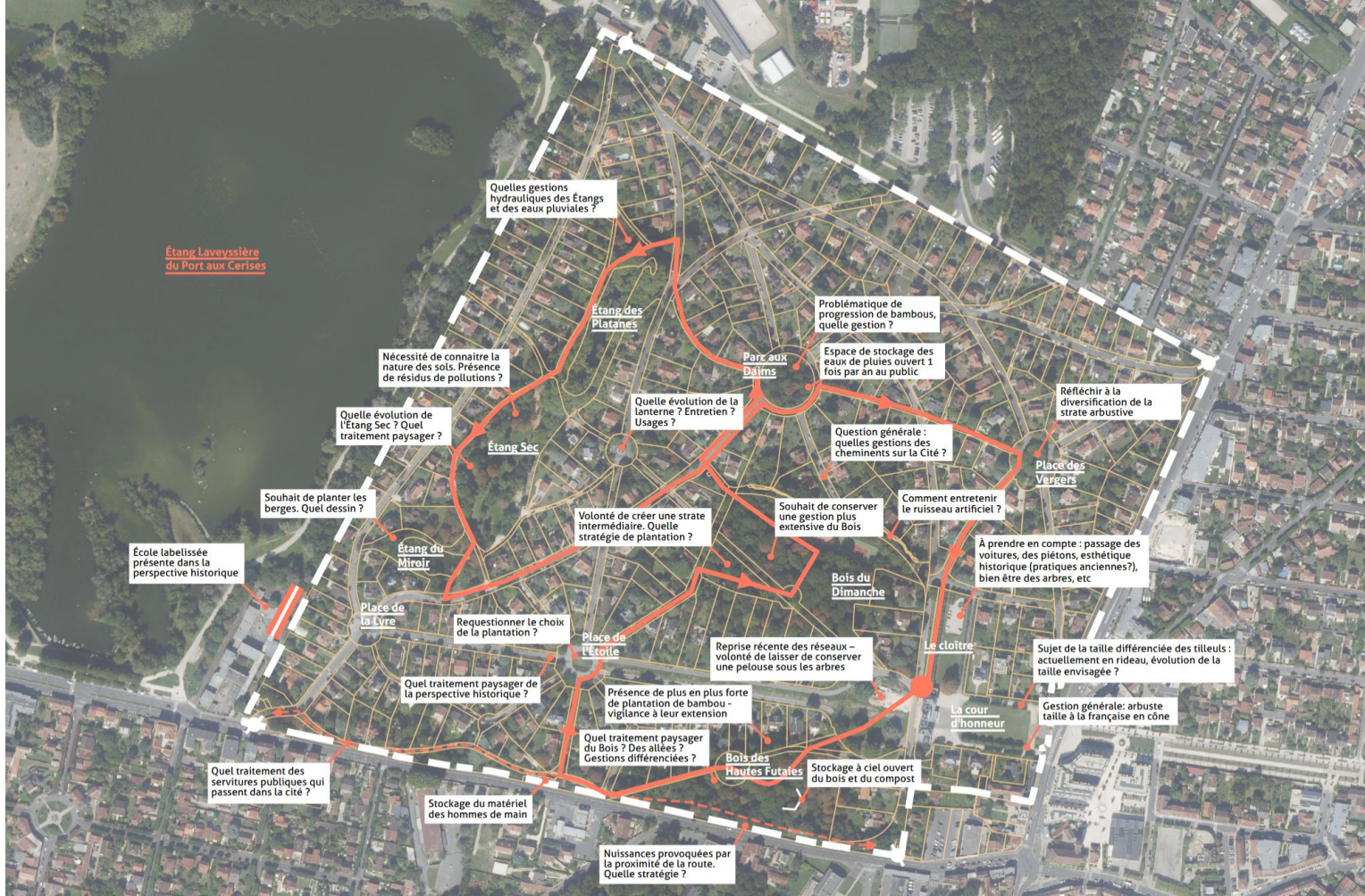
Compte-rendu cartographié de la visite du 26 février 2026